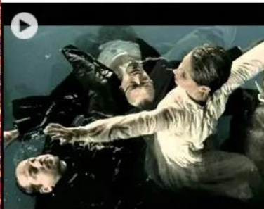
Qulmby - Most múlik pontosan by TomTomMusicOfficial YouTube

Mint kávé csésze alján sűrű zacc, hiába kergetlek el: megmaradsz. Vagy túl hangos rockkoncertek után a fülszengés — némán tátog a száj. Levágott láb után a fantomfájdalom, mindig ott sétálsz a másik oldalon. Illatodtól, lomha hónapok, ha múltnak, a lusta izmok, vágyak megvadulnak. Egy hajszálad a kényes porcicák között. Te ott leszel, bárhová költözök.